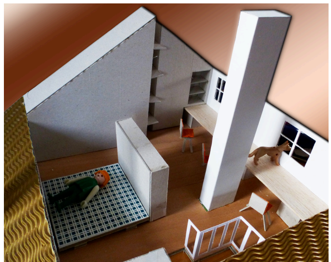
maquette verbouwing zolder